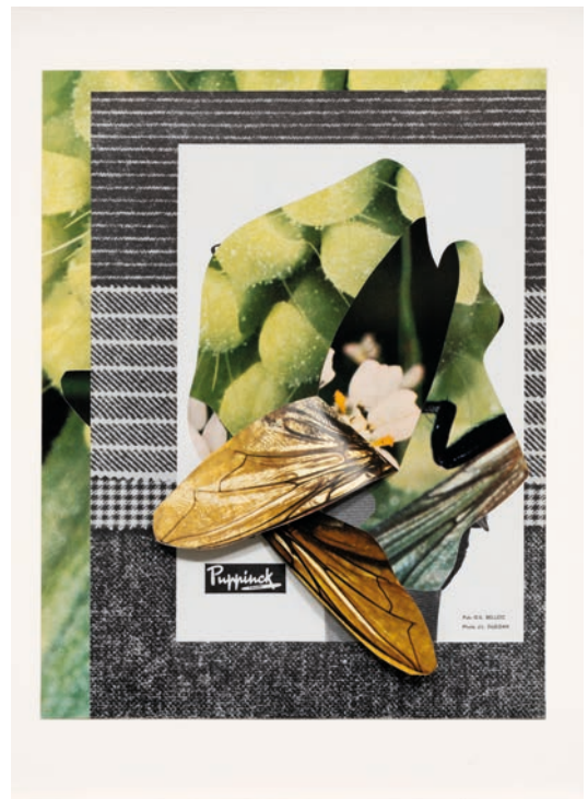
Ailes, Puppink , 2025. Collage. © Éléonore False. Adagp, Paris, 2026.