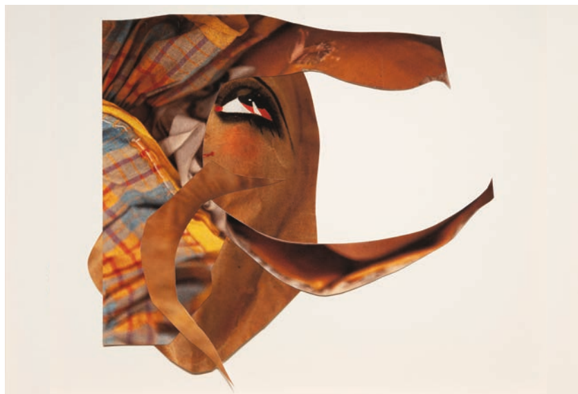
Ombres Roses Ombres #1, 2024. Série "Ombres Roses Ombres". Photographie et collage. Réalisé à partir du fonds Gisèle Tissier-Grandpierre, Nouveau Musée National de Monaco. Photo : Eleonora Paciullo © Éléonore False. Adagp, Paris, 2026.

L E S | T A N N E R I E S C E N T R E D ' A R T C O N T E M P O R A I N D ' I N T É R Ê T N A T I O N A L