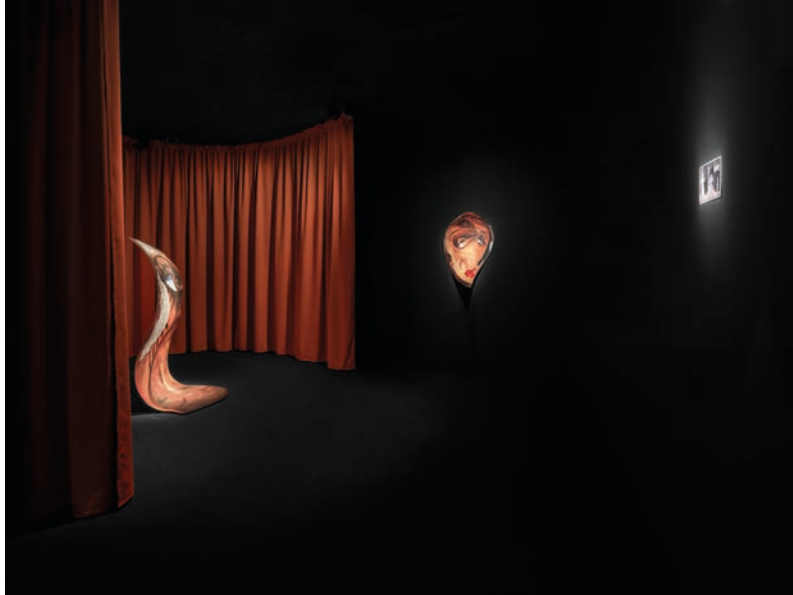
Vue de l'installation Ombres Roses Ombres , 2024. Réalisée à partir du fonds Gisèle Tissier-Grandpierre, Nouveau Musée National de Monaco. Photo : Eleonora Paciullo © Éléonore False. Adagp, Paris, 2026.