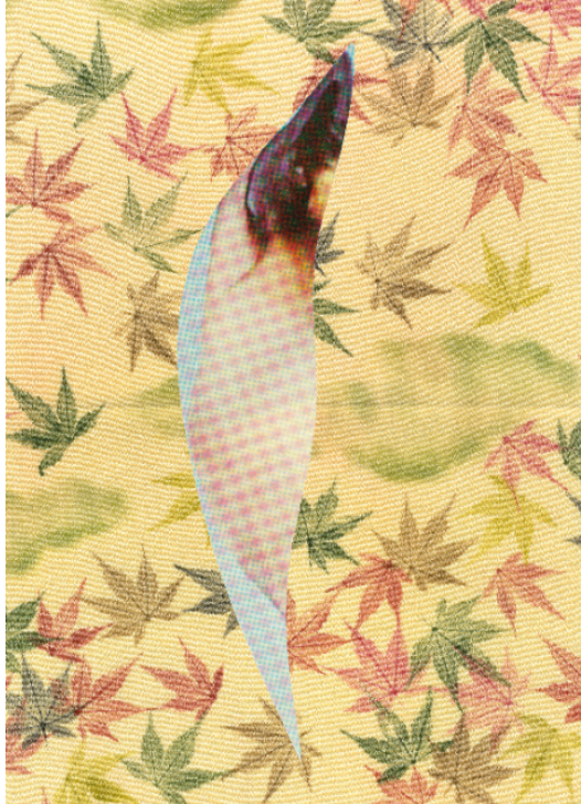
Maquette pour Metabolic #2 , 2025. Série "Metabolic". © Éléonore False. Adagp, Paris, 2026.