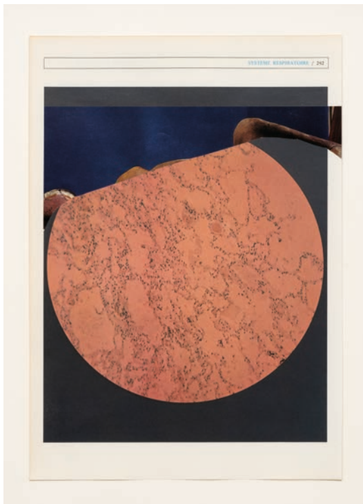
Système respiratoire , 2021. Collage. © Éléonore False. Adagp, Paris, 2026.