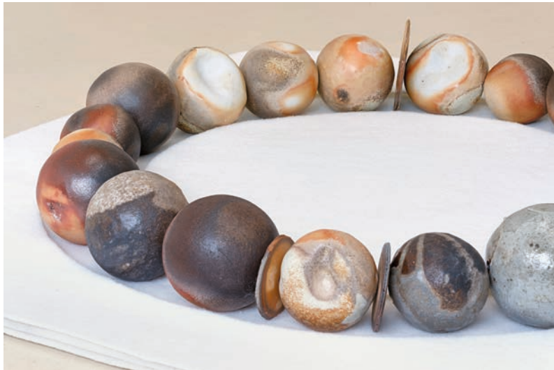
Bracelet , 2024. Série "Perles de terre". Production Centre céramique contemporaine La Borne. © Éléonore False. Adagp, Paris, 2026.