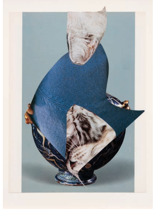
Vase, pull, chat , 2025. Série "Vases". Collage. © Éléonore False. Adagp, Paris, 2026.