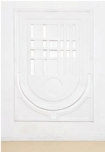
Maquette pour Sœur de jour (Ricordo #1), 2025. Fibre synthétique, couture. © Eléonore False. Adagp, Paris, 2026.

La grande installation au sol donnant son titre à l'exposition tient tout à la fois de l'œuvre et du dispositif scénographique pour trois ensembles de sculptures et de tapisseries. Pensé à l'échelle de l'architecture, ce grand plateau de 15 mètres de long à la texture laineuse définit un espace symbolique sur lequel le spectateur peut circuler. Sa surface incrustée de formes et de lignes dessine le plan d'un plateau d'assemblage. Cet objet utilisé en joaillerie pour organiser le montage des perles d'un collier résonne ici de façon métaphorique avec la pratique du collage, qui sait mieux que d'autres faire tenir ensemble des fragments hétérogènes.