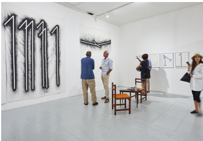
PARÉIDOLIE 2022, vue des œuvres de Michel Dector sur le stand de la galerie Laurent Godin (Paris)

Prolongeant comme chaque année la dynamique de PARÉIDOLIE, la SAISON DU DESSIN s'étend cette année à l'arc méditerranéen, de Nice à Perpignan, avec une programmation d'expositions de dessin contemporain de septembre à décembre 2023.